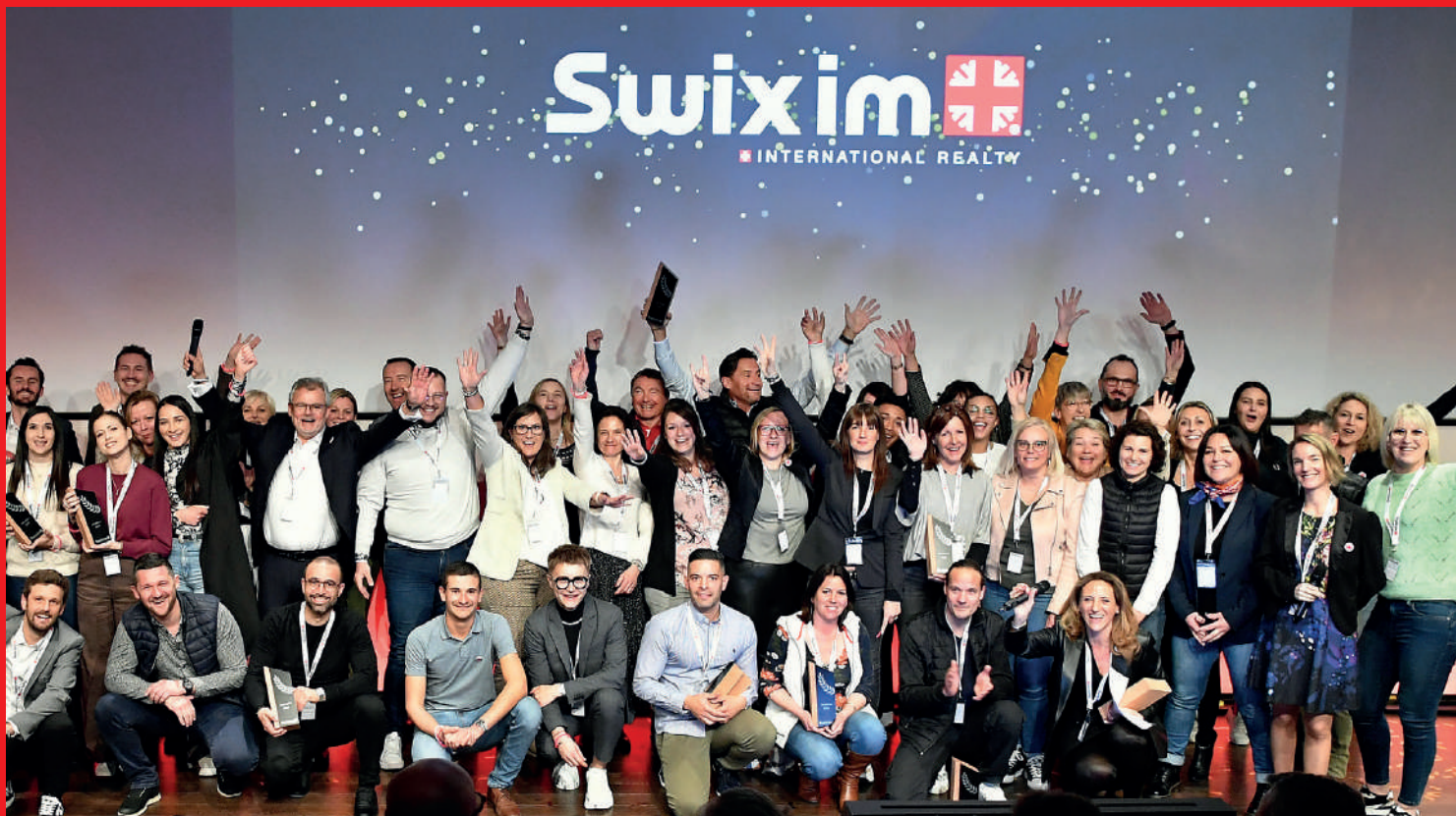
Consegna dei Trofei al Congresso di Losanna 2023

Una network vibrante! Conferenze e seminari internazionali